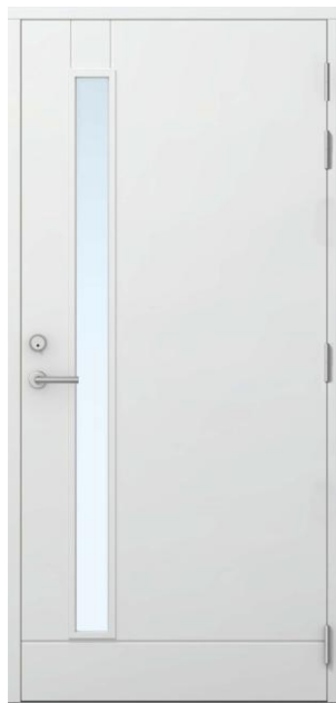
Emma m/glass EI30/Rw42dB, hvit (NCS S0502-Y)

Døren er beregnet til bruk som ytterdør med brann- og lyddkrav EI30/Rw42dB.