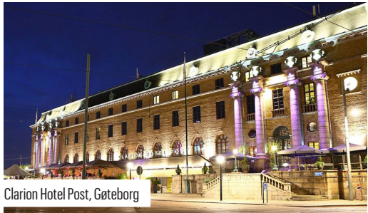
Clarion Hotel Post, Göteborg