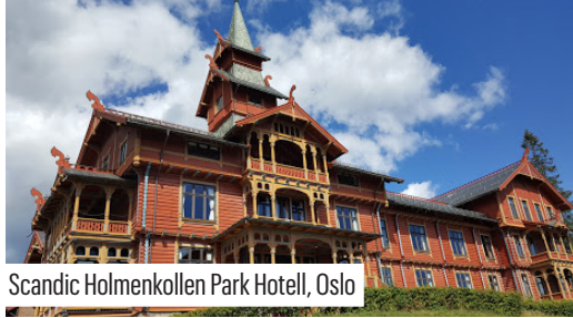
Scandic Holmenkollen Park Hotell, Oslo