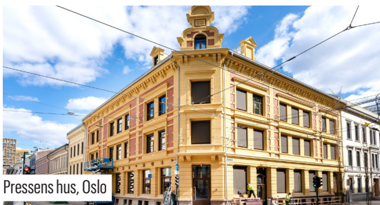
Pressens hus, Oslo