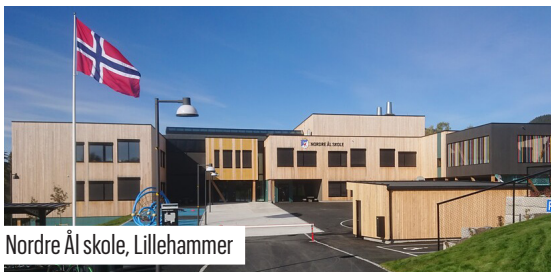
Nordre Ål skole, Lillehammer