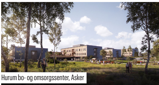
Hurum bo- og omsorgssenter, Asker