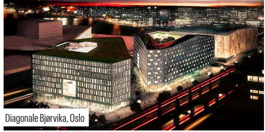
Diagonale Bjørvika, Oslo