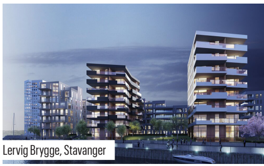
Lervig Brygge, Stavanger