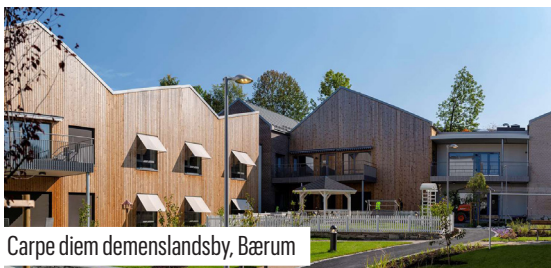
Carpe diem demenslandsby, Bærum