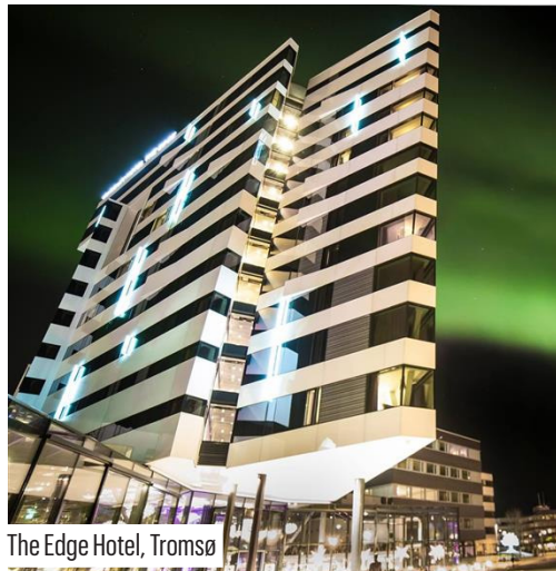
The Edge Hotel, Tromsø